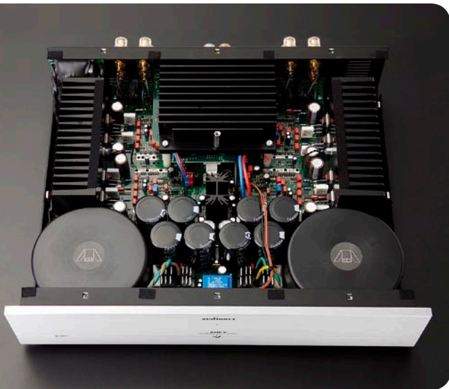
Die „Packungsdichte“ des Amp V sorgt für kurze Wege und damit Schnelligkeit