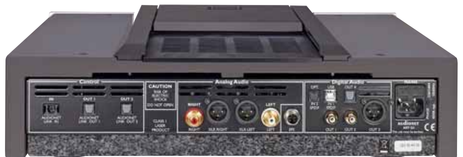
Liebe zum Detail von der Granitbodenplatte über die Rhodium-Kupfer-Sicherung bis zum USB-PC-Eingang

beim neuen Abspieler treu geblieben. Überhaupt sieht das Gerät seinem älteren Bruder sehr ähnlich. Das Laufwerk CD-Pro2LF stammt nach wie vor von Philips, allerdings nunmehr aus der „Pro“-Abteilung. Detailverbesserungen wie der stramm sitzende, zylindrische Puck und die rhodinierte Kupfer-Feinsicherung