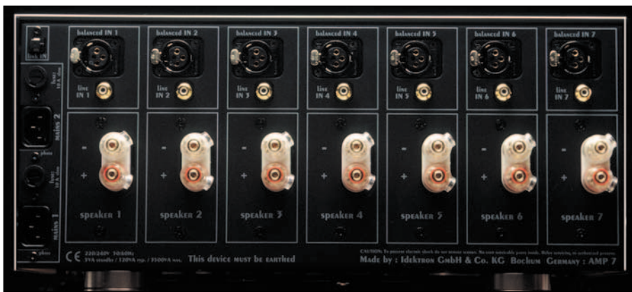
Die Lautsprecher-Anschlüsse des AMP VII.